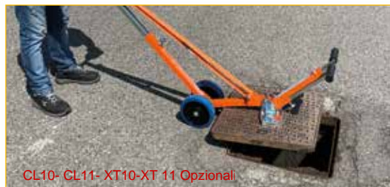
CL10- CL11- XT10-XT 11 Opzionali

Utilizzo 1: sollevamento con gli alzachiusini magnetici CL10 o CL11.