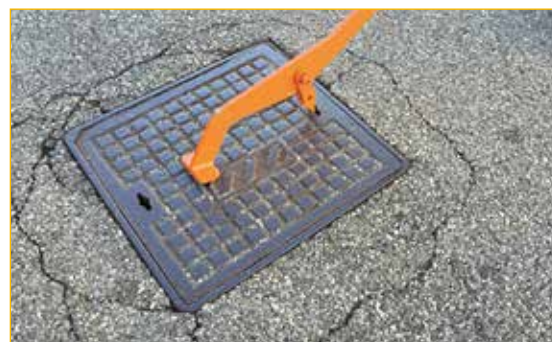
Inserimento del dente nell'asola e rotazione di 90°.