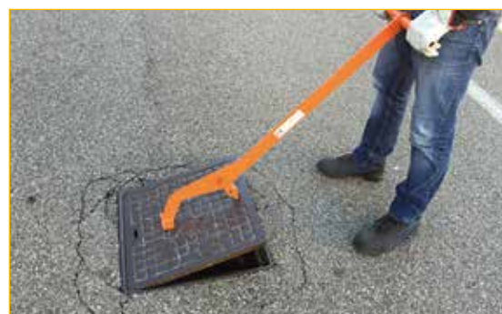
Nell'operazione di sollevamento la lunghezza della leva limita lo sforzo dell'operatore.