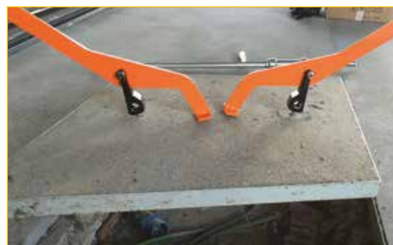
Utilizzo a due utensili per coperchi molto grandi.