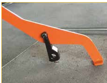
Possibilità di realizzare agganci secondo specifiche necessità.