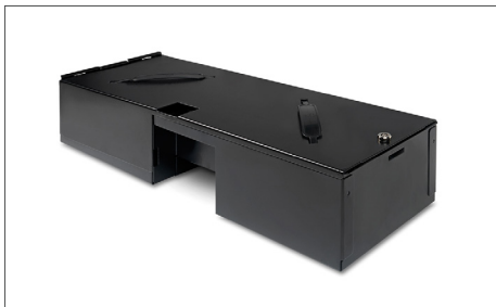
Safescan 4617CL Coperchio bloccabile Art. no: 121-0571